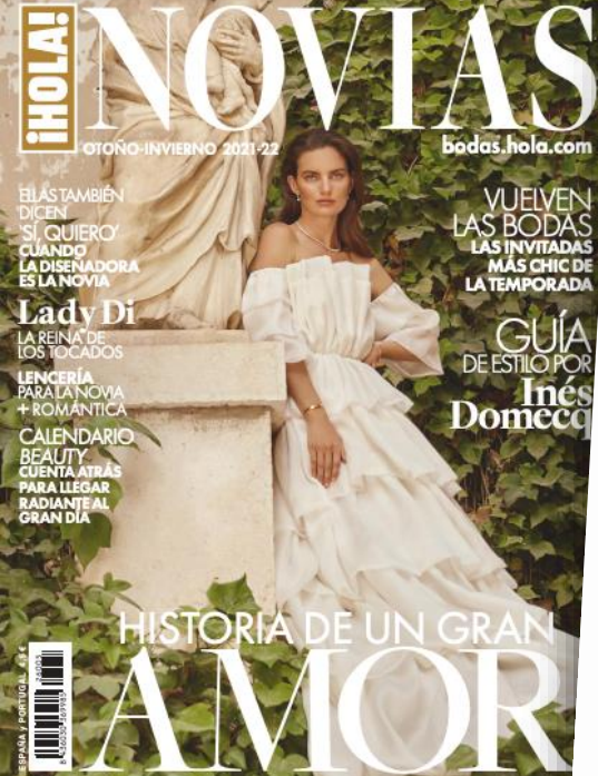
Los colores de las invitaciones representan a los novios. El lenguaje de las bodas de hoy.