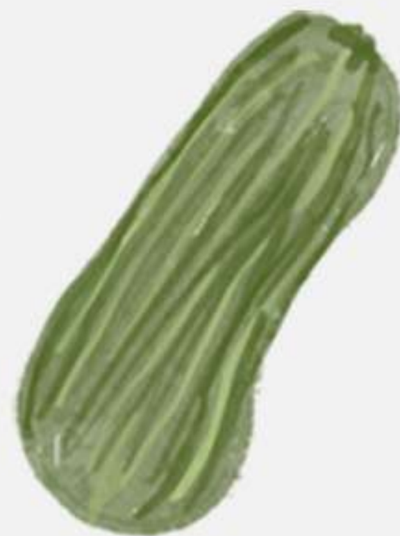
VASCA O MALLORCA